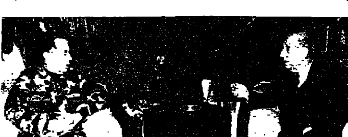
العماد عون مع الرئيس حلو

سئل: كيف تتفكرون ان استمرار العماد عون في ترميمه خصوصا وأنه يحتد من موقف الفاتيكان وفرنسا ذرية، فاجب: انا لا اعلق كعادتي على مواقف الاخوة في لبنان، لكن ليس هناك من شك ان هناك الان اتصالات تمت وحكومة تشككت، والكل يعترف بها ويتعامل معها، وهذا الذي هو ما لنساءه في كل اتصالاتنا والآن في باريس وروما، هناك اعتراف كامل غير مقنن بالشرعية اللبنانية القائمة ويقتضيه معها، وكل الناس بكل تأكيد ان تستكمل الخطوات التالية الضرورية لإعادة بناء الدولة والمؤسسات، وعودة السلام الكامل الى لبنان في ظروف جيدة.